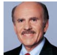
Louis Ignarro, Ph.D. Lauréat du prix Nobel † de Médecine. Membre du Comité International pour la Nutrition, Herbalife